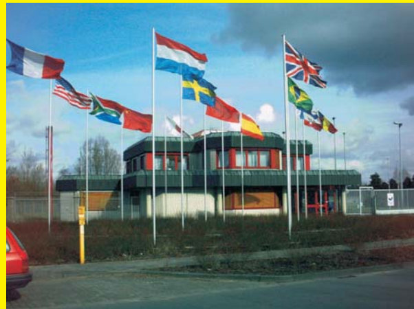
Eingang zur Urananreicherungsanlage Gronau

Das UF_6 wird in UO_2 dekonvertiert, und als Uranpulver zu Tabletten von 10-15 mm Länge und 8-15 mm Durchmesser gepresst. Unter hohen Temperaturen von mehr als 1.700 °C werden diese gesintert, um ein keramisches Material zu formen, mechanisch aufbereitet und in Hüllrohre aus einer Zirkoniumlegierung gefüllt, deren Enden zugeschweißt werden. Eine größere Zahl einzelner Stäbe (bis zu 250) werden gebündelt und formen ein Brennelement. Beispiele für Brennelementefabriken sind die Anlagen in Lingen (D) und Dessel (B).