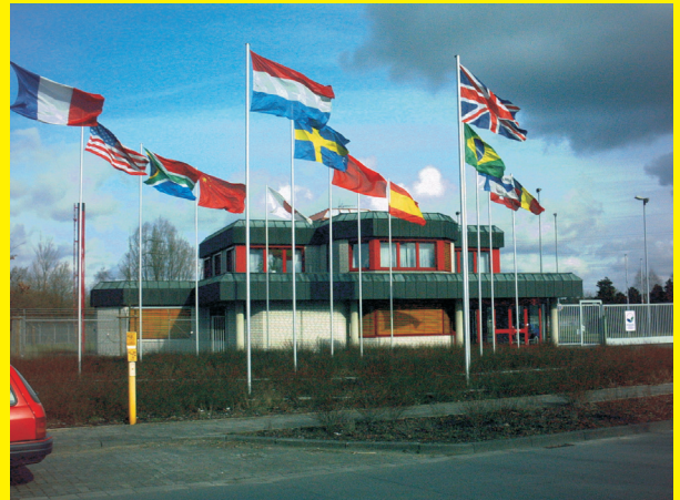
Eingang zur Urananreicherungsanlage Gronau

Das UF_6 wird in UO_2 dekonvertiert, und als Uranpulver zu Tabletten von 10-15 mm Länge und 8-15 mm Durchmesser gepresst. Unter hohen Temperaturen von mehr als 1.700 °C werden diese gesintert, um ein keramisches Material zu formen, mechanisch aufbereitet und in Hüllrohre aus einer Zirkoniumlegierung gefüllt, deren Enden zugeschweißt werden. Eine größere Zahl einzelner Stäbe (bis zu 250) werden gebündelt und formen ein Brennelement. Beispiele für Brennelementefabriken sind die Anlagen in Lingen (D) und Dessel (B).