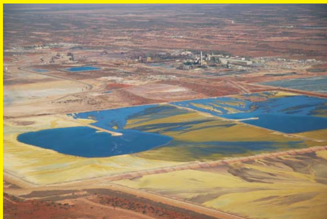
Olympic Dam Mine -kaivoksen rikastusjätealtaat Australiassa

Peter Diehl | Am Schwedenteich 4 | D-01477 Arnsdorf uranium@t-online.de