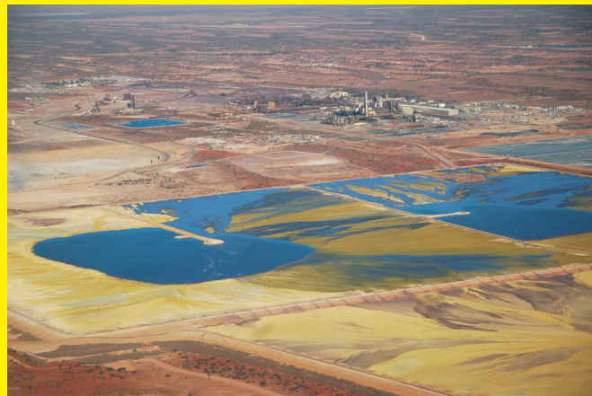
Хвостохранилище на шахте Olympic Dam в Австралии

WISE Uranium project Peter Diehl | Am Schwedenteich 4 | D-01477 Arnsdorf Германия Тел.: +49 34 31 / 589 41 70 | mail@greenkids.de